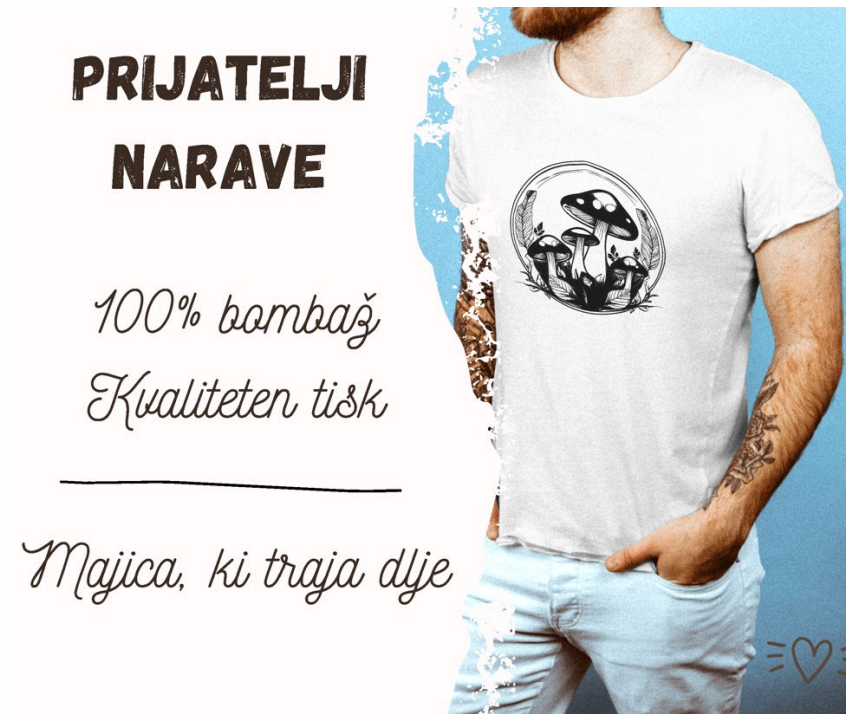
Slika 3: Fotografija za Instagram